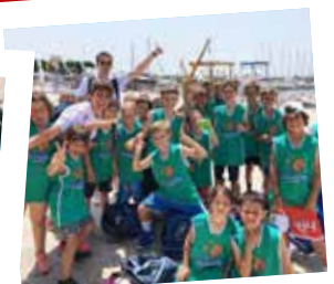
Sul lungo mare...