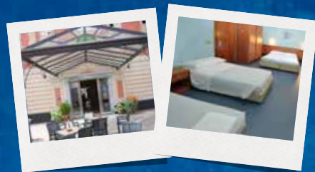
HOTEL SUD EST

I partecipanti al Camp alloggeranno nell'hotel "Sud Est" con sistemazione in camere con bagno.