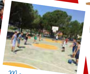
Momenti di gioco