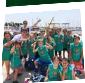
Sul lungo mare...