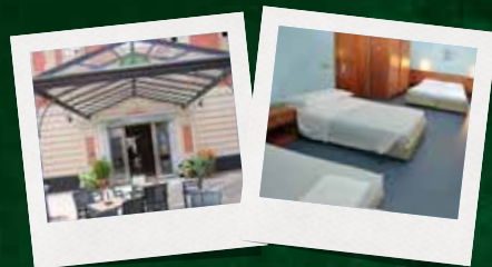
HOTEL SUD EST

I partecipanti al Camp alloggeranno nell'hotel "Sud Est" con sistemazione in camere con bagno.