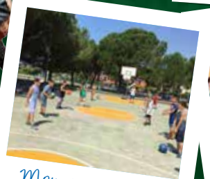
Momenti di gioco